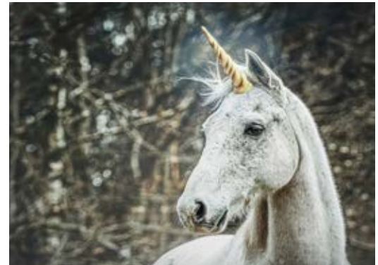
Einhorn: eigenwilliges Fabelwesen

Dagegen werden Unternehmen, die auf Nachhaltigkeit und Kooperation setzen, Zebbras genannt. Sie möchten mit innovativen, sozial-ökologischen Ansätzen relevante Lösungen für gesellschaftliche Herausforderungen des 21. Jahrhunderts realisieren. Oft fehlen ihnen aber Durchschlagskraft, Aufmerksamkeit - und manchmal auch der Schuss „Moonshot-Vision“, um die Welt zu verändern. Dabei sollten gerade diese Unternehmen ambitioniert und nachhaltig wachsen, konsequent skalieren und neue Technologien entwickeln. In diesem Fall erwirtschaften „Zebbras“ überdurchschnittliche Renditen bei überschaubaren Risiken.