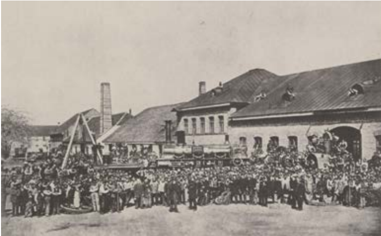
Belegschaft der Lokomotivfabrik Maffei mit der 500. Lokomotive (1864)

Joseph Antons Neffe und Nachfolger, Hugo Alois von Maffei (1836-1921), baute die Aktivitäten weiter aus: 1880 gehörte er beispielsweise zu den Gründungsmitgliedern der Bayerischen Rückversicherungsgesellschaft AG.