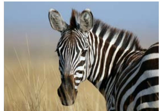
Zebra: kooperatives Herdentier